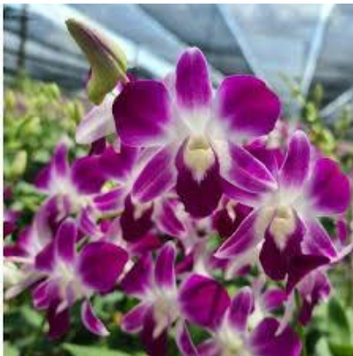
สกุลหวาย

เป็นกล้วยไม้ประเภทที่มีรูปทรงและการเจริญเติบโตคล้ายกับพืชที่แตกกอทั่วไป คือในต้นหนึ่งหรือกอหนึ่งจะประกอบด้วยต้นย่อยหลายต้น ต้นแท้จริงของกล้วยไม้ประเภทนี้จะอยู่ในเครื่องปลูก เช่น กล้วยไม้ในสกุลรองเท้านารี อาจมีลำต้นที่เปลี่ยนแปลงรูปร่างโผล่ยื่นออกมาซึ่งมักบวมเป่ง และทำหน้าที่สะสมอาหาร ต้นส่วนนี้เรียกว่า “ลำลูกกล้วย” เช่น กล้วยไม้ในสกุลหวาย สกุลแคทลียา เป็นต้น กล้วยไม้ประเภทแตกกอมีระบบรากทั้งที่เป็นรากดิน รากกิ่งดินและรากกิ่งอากาศ กล้วยไม้ดินมีการเรียงตัวของใบม้วนซ้อนเวียนกันไป ส่วนกล้วยไม้อากาศเรียงซ้อนทับกัน การออกดอกบางชนิดออกดอกที่ยอด บางชนิดออกดอกที่ตาข้างตามข้อของลำลูกกล้วย บางชนิดออกดอกได้ทั้งที่ตายอดและตาข้าง บางชนิดออกดอกเฉพาะลำลูกกล้วยที่ทิ้งใบหมดแล้ว โคนเส้าเกสรยื่นยาวออกไปและเชื่อมติดกันกับกลีบรองดอก ลักษณะการถือฝักและเมล็ด ปลายฝักจะห้อยชี้ดิน เมล็ดที่สมบูรณ์เมื่อแก่จะมีสีเหลือง ส่วนเมล็ดดิบมีสีขาว กล้วยไม้ที่จัดอยู่ในประเภทแตกกอได้แก่ กล้วยไม้สกุลรองเท้านารี สกุลหวาย สกุลแคทลียา สกุลออนซีเดียม และสกุลแกรมมาโตฟิลลัม