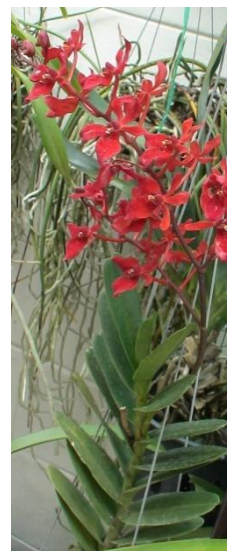
สกุลเรแนนเธอร่า