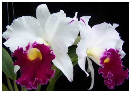
สกุลแคทลียา