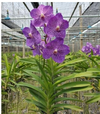
สกุลแวนด้า

เป็นกล้วยไม้ที่มีการเจริญเติบโตขึ้นไปทางส่วนยอด คือตาที่ยอดจะแตกใบใหม่เจริญขึ้นเรื่อยๆ ส่วนโคนต้นจะออกรากไล่ตามขึ้นไป เมื่อกล้วยไม้มีอายุมากขึ้นส่วนของโคนจะแห้งตายได้ยอดขึ้นไป กล้วยไม้ประเภทนี้มีระบบรากแบบรากอากาศ การเรียงตัวของใบเป็นแบบซ้อนทับกัน และตัวใบต่างมีข้อต่อกับกาบใบ ส่วนมากเนื้อใบหนาแบน บางสกุลมีใบเป็นก้านกลมดุกคล้ายกิ่งกลีบรองดอกคู่ล่างมักเชื่อมติดกัน ทำให้เกิดเป็นรูปกางเขน กลีบกระเป๋าด่างติดอยู่ตรงโคนเส้าเกสร และมักจะมีเดือยหรือไม่มีก็เป็นรูปดุกในหลอดเดือย หรือดุกนี้มักมีตุ่มหรือดิ่งปรากฏอยู่เสมอ กลุ่มเรณูมีจำนวน 2 กลุ่ม มีก้านส่งยาวและกลุ่มเรณูหนึ่งๆ จะมีร่องความยาวปรากฏให้เห็น การออกดอกจะออกที่ตาตามข้อของลำต้นเท่านั้นไม่ออกที่ยอด ลักษณะการถือฝักและเมล็ด ปลายฝักจะตั้งชี้ขึ้น เมล็ดที่สมบูรณ์จะมีสีน้ำตาล ส่วนเมล็ดลีบมีสีขาว กล้วยไม้ที่จัดอยู่ในประเภทไม้แตกกอได้แก่ กล้วยไม้ในสกุลแวนด้า สกุลเข็ม สกุลช้าง สกุลกุหลาบ สกุลเสือโคร่ง สกุลม้าวีง สกุลแมลงปอ สกุลเรแนนเธอร่าและสกุลแวนด้าอพิซิส