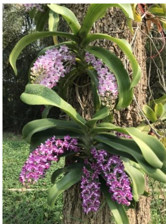
สกุลช้าง