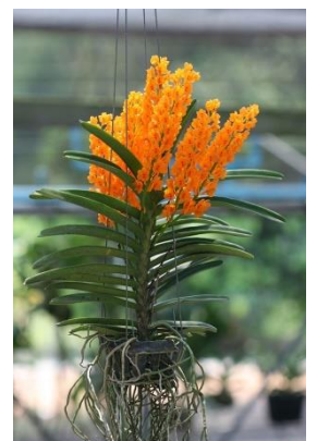
สกุลเข็ม